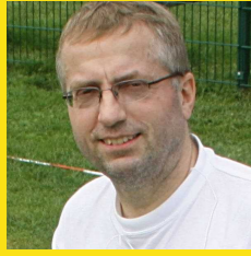
Autor: Martin Baumgärtner